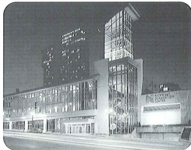
Nashville Convention Center

ダウンタウンの中心に位置する市営のコンベンション施設。規模的には中規模のものですが、隣接するアリーナ、ルネッサンスホテルに加え近隣の10ホテルと有機的に結合することにより機能の強化を図っており、キャパシティ的には10,000人規模まで可能です。