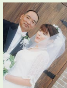
僕は今まで以上に幸福になりました。