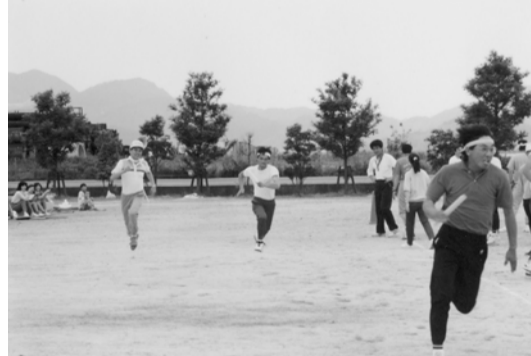
西部青年中央会に入会して数年後のレクリエーション例会でのリレーにてワンショット！走り終えたあと呼吸がとまりそう、5分間動けなかった思い出があります。先輩からバトンを受け取り全力で走り後輩にバトンをつなぐ。私の西部青年中央会生活のゴールの前に笑顔で完走したいと思っております。

今年のマラソン部は、昨年同様に楽しく、熱く、一生懸命にそして効率よく行動し、地域及び選手そしてボランティアの心に残る大会にする。また、中央会会員同士の絆がより深くなるような大会になれば良いと