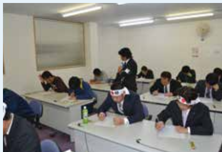
第1回侍テスト会場の風景