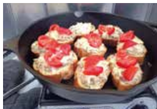
↑オイルサーディン&バケットのオープン焼き