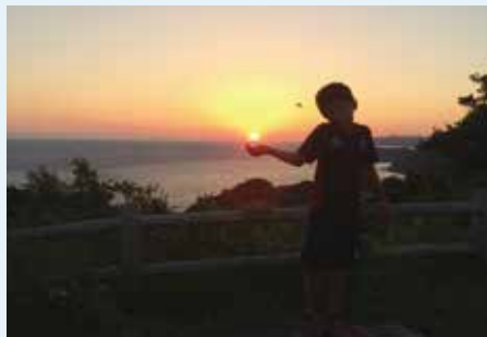
多古鼻の日の出 (広報委員会多古鼻キャンプより)