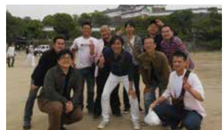
卒会旅行:平成27年5月23日(土)～5月24日(日) 行き先:関西方面

まあ半分冗談で書いておりますが、それだけたくさん時間をこの〇〇委員会につき込んで頂きました。そんな〇〇委員会のメンバーは次年度も大活躍すること間違いなしです。そういえばみなさん、〇〇に入る本当の言葉、覚えていますか?〇〇とは「輝く組織! 創造」ですよ。