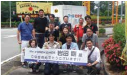
卒会旅行:平成27年5月30日(土)～5月31日(日) 行き先:下関

今後も仕事上すぐに電話に出られないことがあると思いますが、ラーメンを作っていると思って頂きご容赦ください。必ず折り返しのお電話を致しますので。