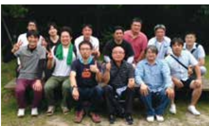
卒会旅行:平成27年6月13日(土) 行き先:夕陽の丘神田

また、これまで欠席が目立った会員も、今年の委員会は面白いと言って出席していただけたことも大変うれしかったです。