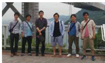
卒会旅行:平成27年5月23日(土)～5月24日(日) 行き先:福岡

何度となく飛行テストを繰り返したのですが、なかなかうまく飛行してくれません。昨今重要施設や人がたくさん集まるところでドローンが落下して問題となったニュースが流れる中、びくびくしながら夜遅くまで頑張ってはいたのですが…。実はドローンは安いものだと1万円からネットで売っています。みなさんも安いドローンには気を付けましょう。