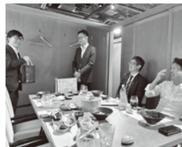
リベラルアーツ委員会